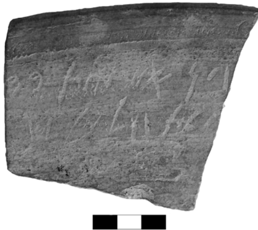
Fig. 2. Ostracon, face A.