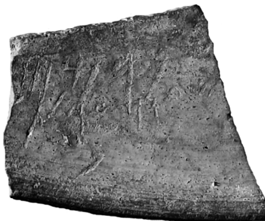
Fig. 3. Ostracon, face B.