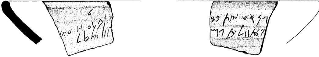
Fig. 1. Ostracon replacé sur l'assiette (reconstruction et dessin Maia et alii 2003, 70 , fig. 7).