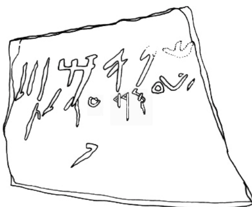
Fig. 4. Ostracon, dessin de la face B (par J.-Á. Zamora Lopez - A. De Bonis).