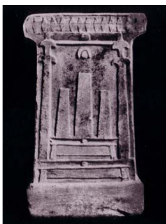
Fig. 11. Stele con altare a tre betili da Cartagine (Bisi 1967, tav. VI, 1).