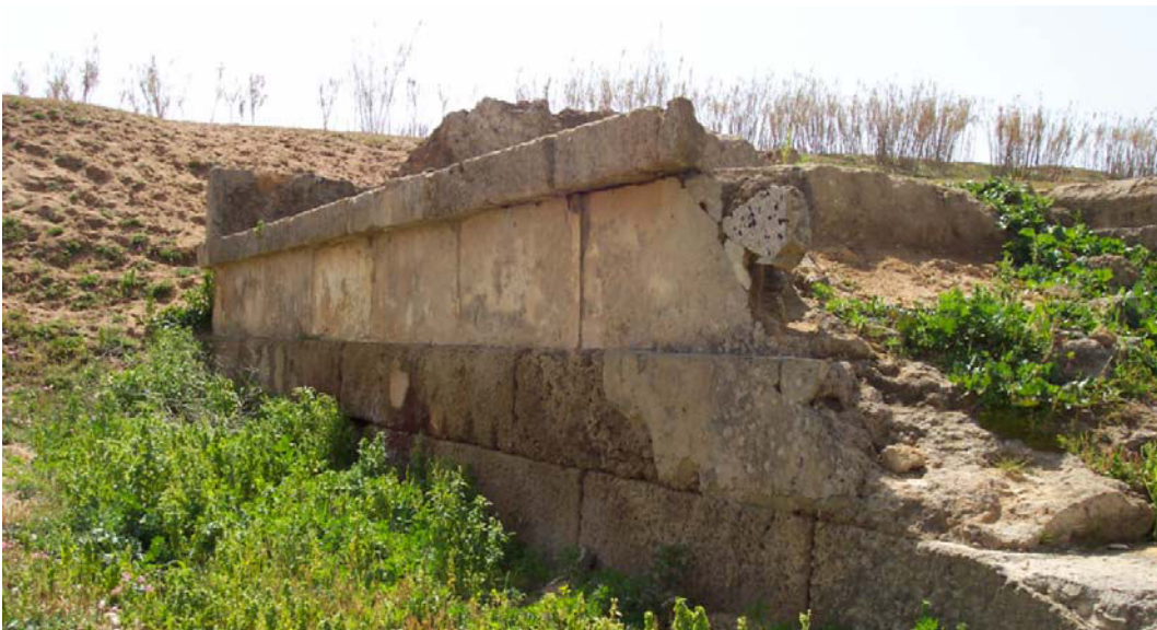
Fig. 6. Selinunte, Gaggera: lato orientale dell'altare (tracce di intonaco sul secondo filare), da nord-est.