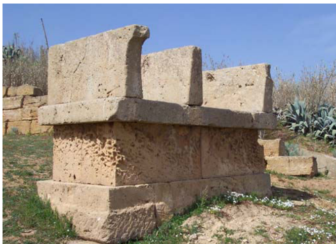
Fig. 9. Selinunte, Gaggera: altare a tre betili ad ovest del tempio del Meilichios, da sud-est.