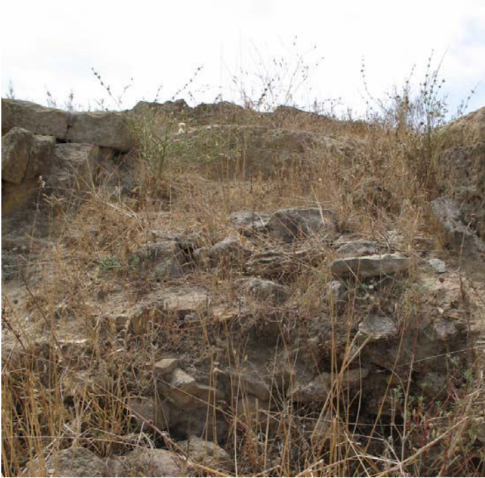
Fig. 5. Selinunte, Gaggera: la massicciata all'interno dell'altare, da nord.