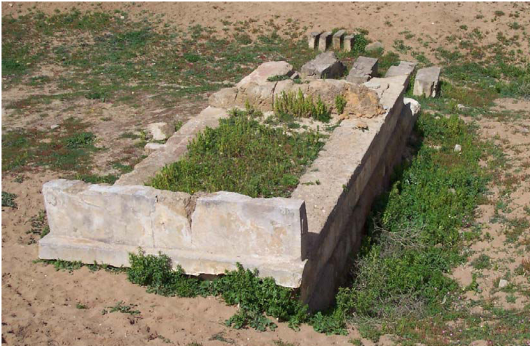
Fig. 4. Selinunte, Gaggera: altare a tre betili antistante l'edificio "Triolo Nord", da sud-est.