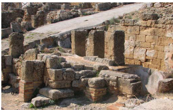
Fig. 10. Solunto, Area sacra: altare a tre betili, da nord est.