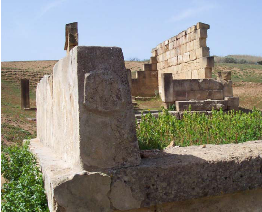
Fig. 7. Selinunte, Gaggera: betilo posto all'estremità meridionale dell'altare, da sud-est.