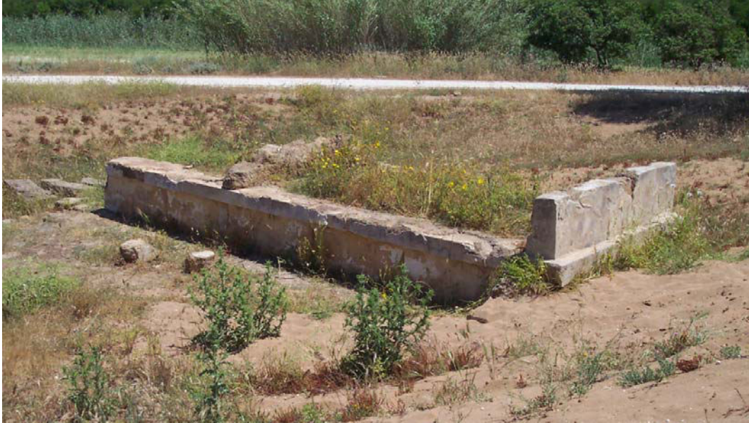
Fig. 3. Selinunte, Gaggera: altare a tre betili antistante l'edificio "Triolo Nord", da sud-ovest.