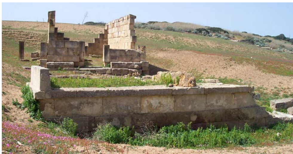
Fig. 2. Selinunte, Gaggera: altare a tre betili antistante l'edificio "Triolo Nord", da est.