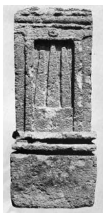
Fig. 12. Stele con altare a tre betili da Mozia (Moscati - Uberti 1981, tav. CVII, 677).